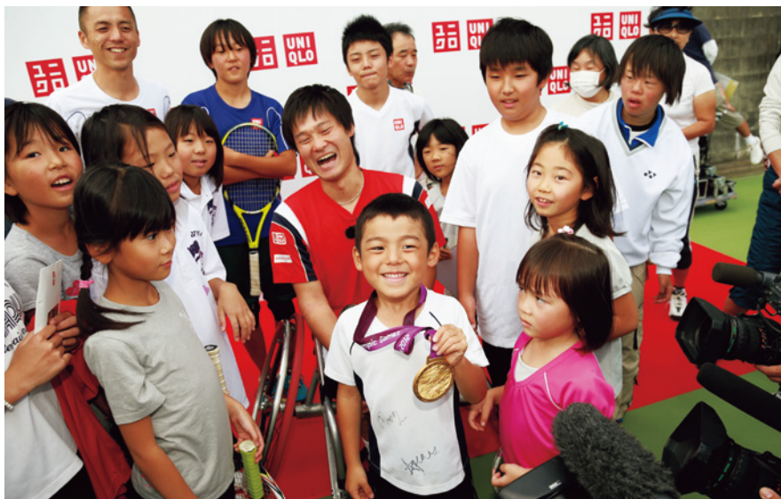
J'ai visité Ishinomaki dans la préfecture de Miyagi, au nord-est du Japon en automne 2012 en tant que membre du Projet UNIQLO d'aide à la reconstruction après le séisme et le tsunami de mars 2011. J'ai lancé quelques balles avec des enfants du club de tennis Lawn d'Ishinomaki et répondu aux questions de l'assemblée de l'école élémentaire de Kamo. J'entends encore les encouragements et les applaudissements du public.

Les spectateurs peuvent déjà se réjouir des matchs endiablés de tennis en fauteuil roulant auxquels ils pourront assister aux Jeux Paralympiques de 2020, et mon rêve est que les gradins soient remplis à chaque match.